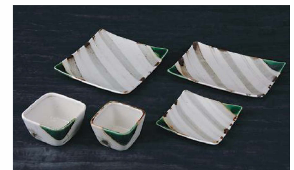
織部志野ストライプ