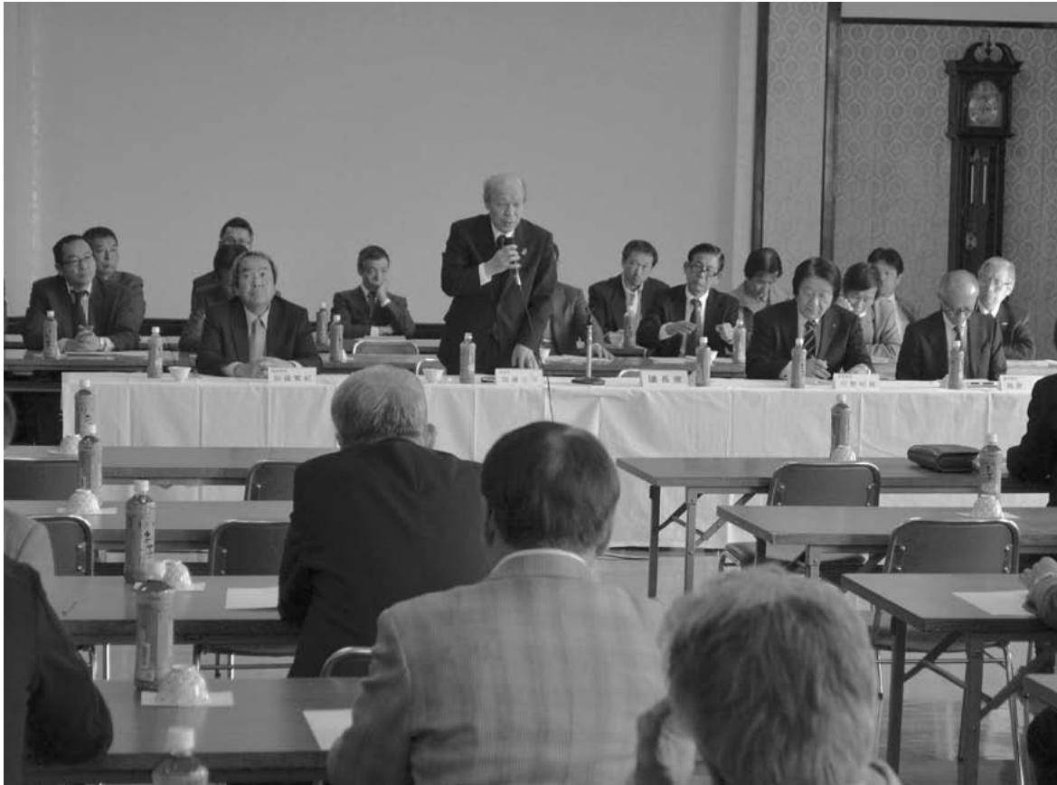
写真：第142回臨時総代会 (記事2ページ)

発行日 毎月 20日 定 価 1部 10円 (但し組合員については 賦課金に含めて徴収)