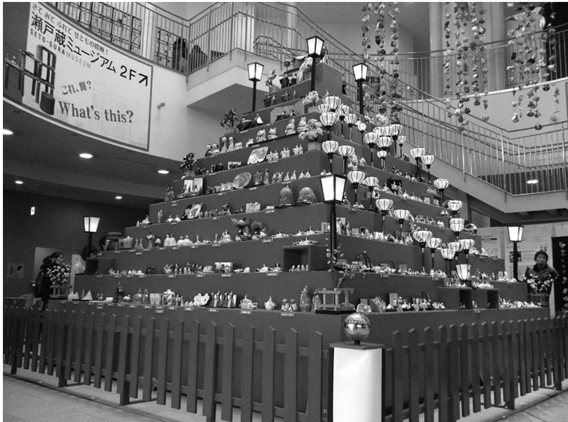
写真：陶祖800年祭記念 第13回陶のまち瀬戸のお雛めぐりで瀬戸蔵に飾られた“ひなミッド”

発行日 毎月 20日 定 価 1部 10円 (但し組合員については 賦課金に含めて徴収)