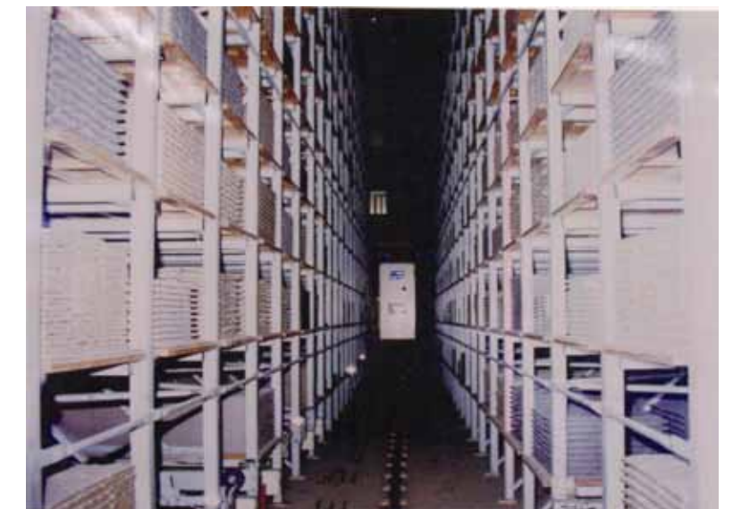
タイル用製品ラック