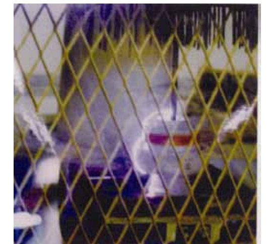
ガイシの電気試験